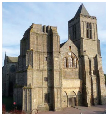
Façade ouest et parvis de la cathédrale de Dol-de-Bretagne